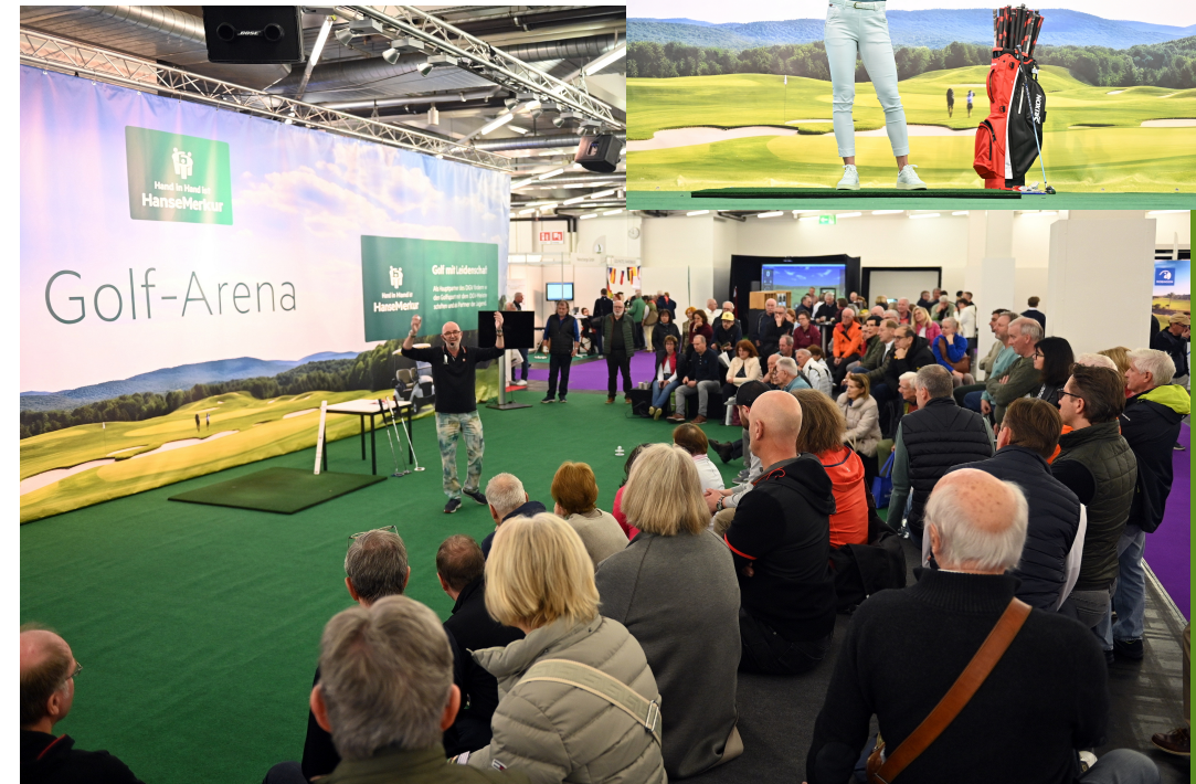
Die Golf-Arena presented by HanseMerkur 2024

Jedes Paket kann noch individuell besprochen werden.